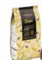
JIVARA MJÖLK 40% 3 kg Art nr 46411