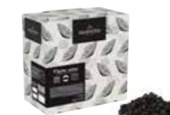
DROPS MÖRK 52% 6 kg Art nr 46413 ANSKAFFNING