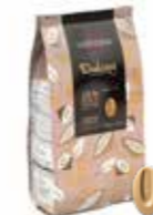
DULCEY BLOND 35% 3 kg Art nr 46412