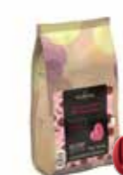
INSPIRATION HALLON 3 kg Art nr 46418