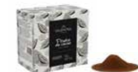
KAKAOPULVER 3 kg Art nr 46416