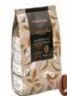
CARAMELIA MJÖLK 36% 3 kg Art nr 46406 ANSKAFFNING