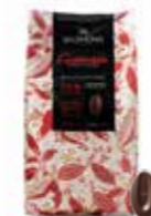
GUANAJA MÖRK 70% 3 kg Art nr 46408