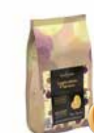
INSPIRATION PASSION 3 kg Art nr 46414 ANSKAFFNING