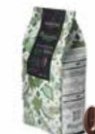
MANJARI MÖRK 64% 3 kg Art nr 46402