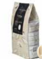
IVOIRE VIT 35% 3 kg Art nr 46409