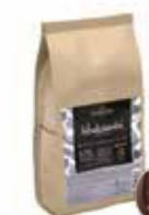
HUKAMBI MÖRK MJÖLK 53% 3 kg Art nr 46401