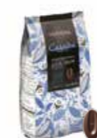
CARAÏBE MÖRK 66% 3 kg Art nr 46410